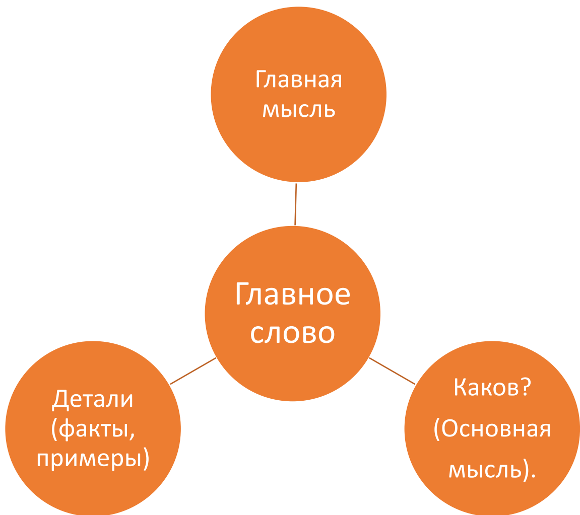
Схема «Понятие и определение».